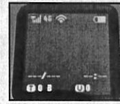
正常時の画面 (左上にアンテナと、 4Gが表示されます)